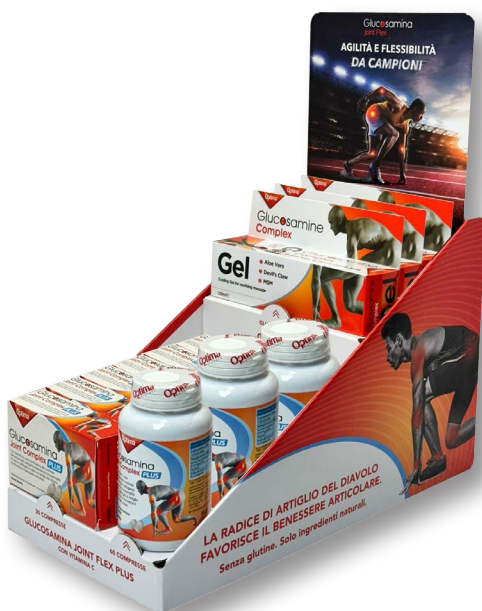
11- Microonda, crowner staccato + frontalini anticaduta