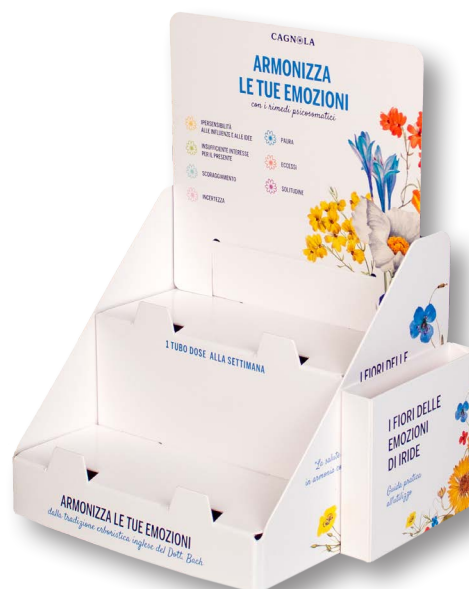
4- Teso+teso, crowner intercambiabile + taschina porta leaflet + frontalini anticaduta