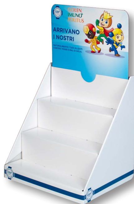
2- Microonda, crowner intercambiabile