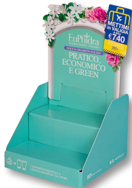
6- Teso+teso, crowner staccato e sagomato