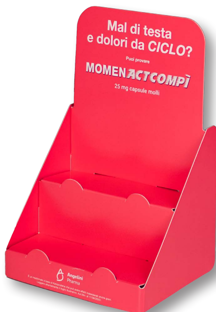
3- Teso+teso, crowner attaccato + frontalini anticaduta