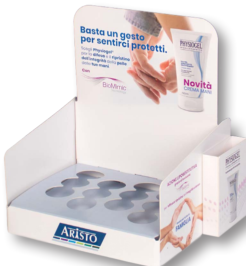
7- Teso+teso, alloggio "infossato" + taschina porta leaflet