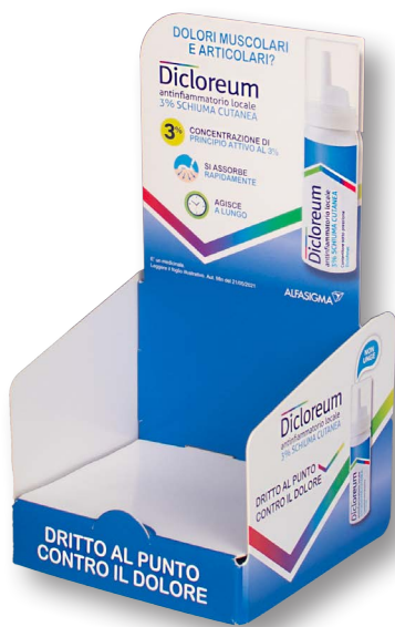
5- Teso+teso, crowner sagomato + frontalino anticaduta