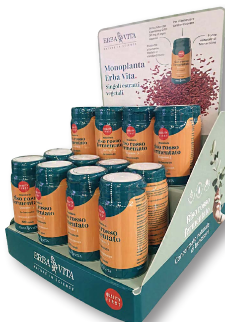
10- Teso+teso, crowner staccato