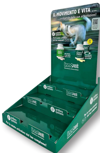
9- Microonda, plastificato + frontalini anticaduta