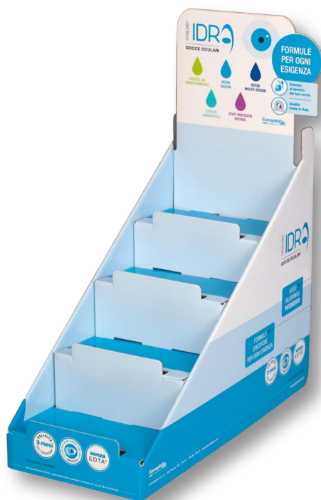
1- Microonda, crowner sagomato + frontalini anticaduta