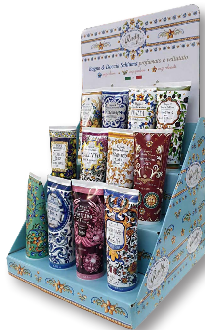
8- Microonda, alloggio "infossato"