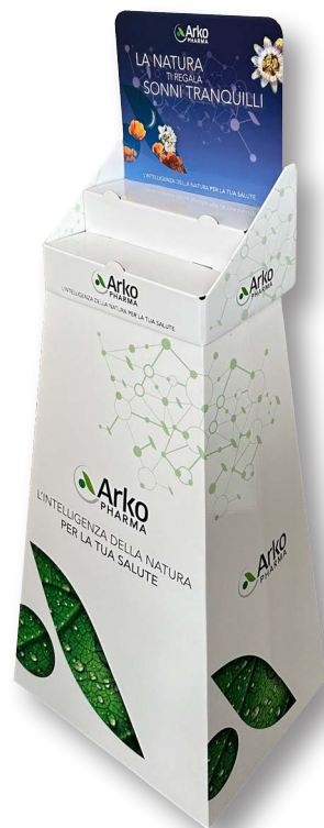
12- Autoexpo avancassa a scaletta su colonna + crowner intercambiabile